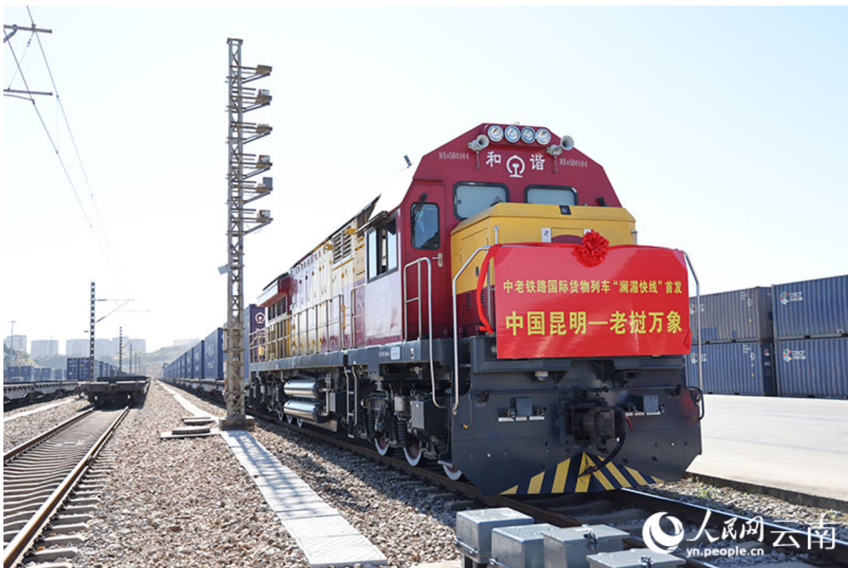
2022年1月10日，中老铁路国际货物列车“澜湄快线”首发。